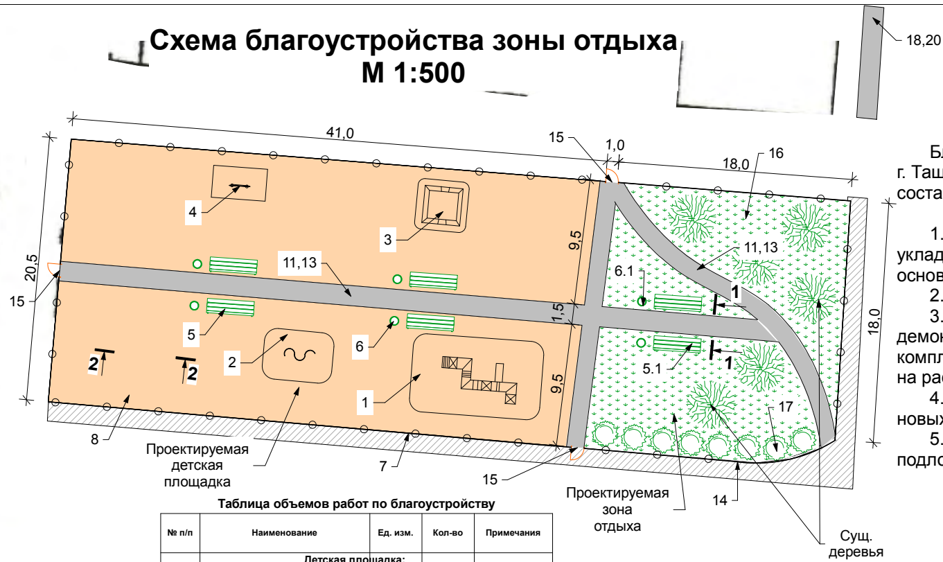
Схема благоустройства зоны отдыха М 1:500